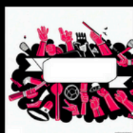
CLUB - ASSOCIATION