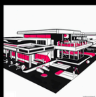
COMPLEXE DE LOISIRS